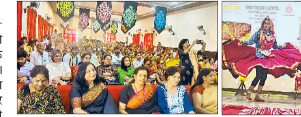
रोहतक। कार्यक्रम में मौजूद दर्शक व प्रस्तुति देती छात्रा।