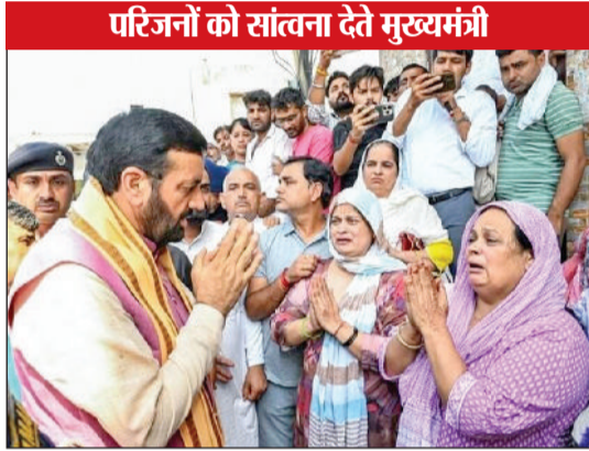
परिजनों को सांतवना देते मुख्यमंत्री