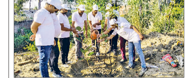
रोहतक। पौधारोपण करते सेवा और समर्थन निरवाह्य मंडल के सदस्य।