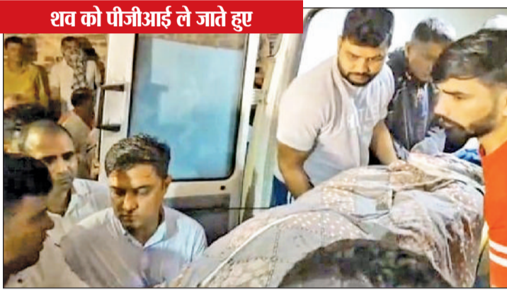
शव को पीजीआई ले जाते हुए