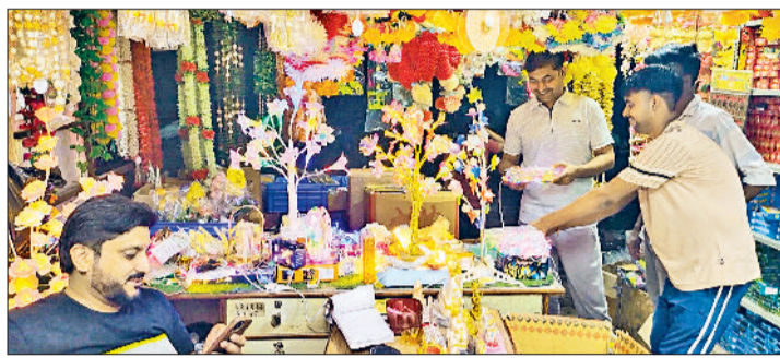
रोहतक। माल गोदाम रोड पर एक दुकान से सामान खरीदते।

» अधिकारियों ने बताया कि उनका मुख्य उद्देश्य चोरी, जेबकतरी और दुर्घटनाओं पर रोक लगाना है। पुलिस ने दुकानदारों और ग्राहकों को भी सतर्क रहने की सलाह दी है और किसी भी संदिग्ध गतिविधि की सूचना तुरंत 112 या 100 नंबर पर देने के लिए कहा है।